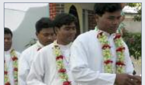
Auf dem Weg zur Weihe: Diakone in Bangladesch.