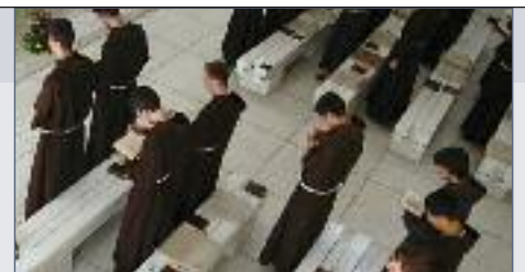
Sie haben der Welt immer geholfen: Franziskaner in Sarajewo.

Die Misere ist groß. In Osteuropa unterstützen wir heute fast jedes Seminar. Ohne Eure Hilfe könnte mancher Ruf Gottes nicht beantwortet werden, bliebe mancher Beichtstuhl leer, gäbe es keine heilige Messe, keine Kirche. “Wenn Gott die Kirche so sehr liebte, dass er Sein Leben für sie opferte, dann bedeutet das, dass sie auch unsere Liebe verdient”, schrieb Johannes Paul II. Die Priester trocknen die Tränen Gottes, sie beten für uns, sie haben unsere Liebe verdient. Nicht nur in Bosnien-Herzegowina. ●