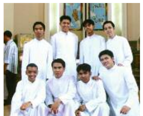
Philippinen: Achtmal Hoffnung für die Kirche.