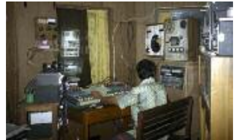
Senden auch für vergessene Völker: Programm für die Karen in Myanmar.