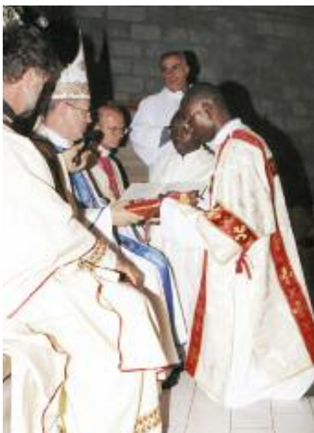
Weihe in Kamerun: "Du bist Priester auf ewig..."

für den Klerus – die Welteinkehrtage für Priester statt. Gepredigt werden sie vom Wiener Erzbischof Christoph Kardinal Schönborn und ihr Leitmotiv lautet: "Für das Heil der Welt zum Priester geweiht: