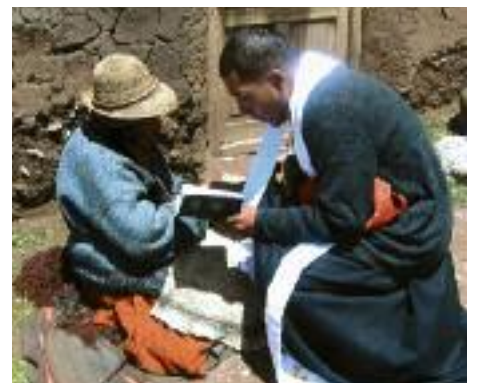
Trost nach dem Beben. Zuspruch für ein Opfer.