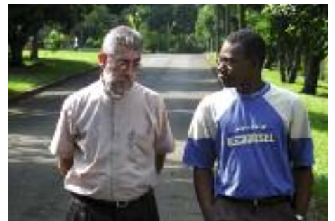
Kolumbien: Ein Seminarist im Gespräch mit dem geistlichen Leiter.