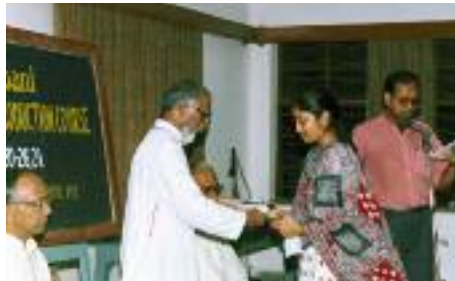
Schreiben lernen, um besser zu sprechen: Workshop bei “Radio Veritas”.