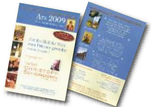
Besinnung auf das Wesentliche: Das Programm der Welteinkehrtage.