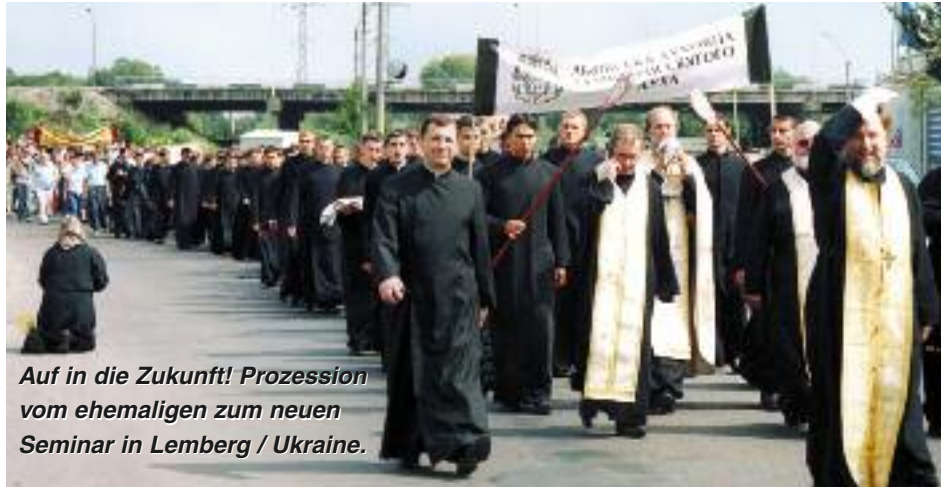
Auf in die Zukunft! Prozession vom ehemaligen zum neuen Seminar in Lemberg / Ukraine.

Welche Freude!" Ihr helft besonders armen Priestern, das Bewusstsein dieser tiefen Freude zu erneuern. Ohne Eure CHF 37.800 könnten hundert Priester aus Afrika, Asien, China und Lateinamerika es sich schlicht nicht leisten, nach Ars zu