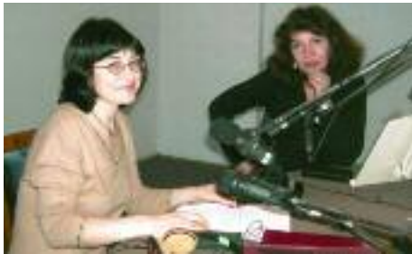
Botschaften der Freude: Im Studio von “Radio Auferstehung” / Ukraine.

lich im Medienapostolat bestärkt hat, über die Ohren die Herzen der Menschen zu öffnen – in Lateinamerika, Asien, Afrika und auch in Osteuropa, überall da, wo wir Radio- und Fernsehsender unterstützen, damit die Wahrheit erkannt werde. ●