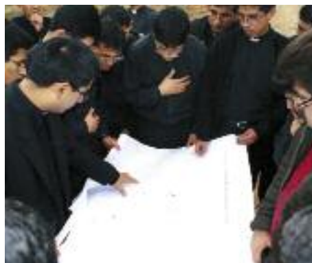
Die Pläne für ein Seminar genau studieren: Die Erde in Peru bebte häufig.