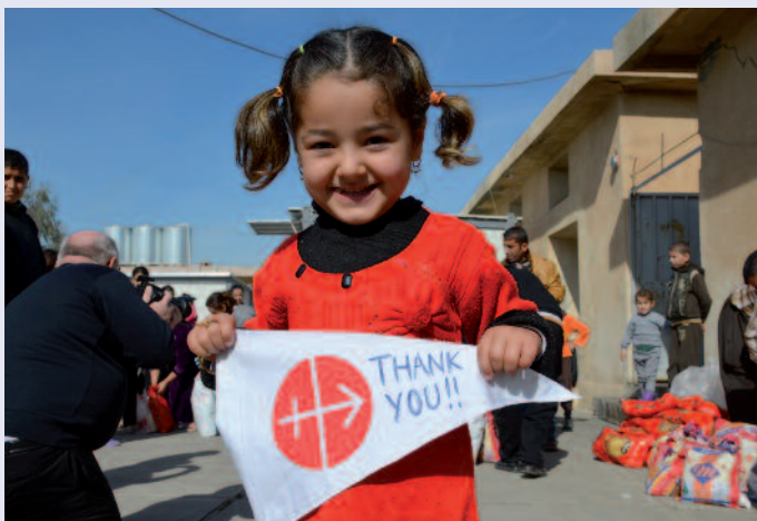
“Ohne Euch hätten wir keine Zukunft”: Der Dank des kleinen Mädchens steht für Millionen Christen.

Auch 2015 stand die Not der Christen im Nahen und Mittleren Osten im Mittelpunkt der medialen Aufmerksamkeit – und unserer Hilfe. Die Kosten für die Sofort-Hilfsmaßnahmen und auch für strukturelle Projekte haben sich mehr als verdoppelt und machen mittlerweile mehr als ein Fünftel (21,6 Prozent) des gesamten Budgets aus, übertroffen nur noch von Afrika mit 29,3 Prozent. Die Hilfe für Syrien verdreifachte sich. In allen Regionen ist in absoluten Zahlen ein Anstieg der Hilfen zu verzeichnen, von Osteuropa (um 1,5 Millionen), über Afrika (um 7,8 Millionen) bis zum Nahen und Mittleren Osten (um 11,5 Millionen). Aus Afrika kamen wie im letzten Jahr die meisten Hilfsgesuche, 2093 Projekte wurden bearbeitet, die zweitmeisten kamen aus Osteuropa und Asien/Ozeanien . Nach Afrika und Asien gehen auch die meisten Mess-Stipendien. Lateinamerika bleibt zwar der vitale, junge Kontinent, aus ihm gehen viele neue katholische Gemeinschaften hervor, aber Sekten und Drogen wachsen wie das Unkraut mit. Dort muss besonders viel in die Katechese investiert werden.