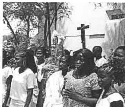
Bischof Happe mit Firmlingen. Kirche in Not

Andreaskirche Der Bischof wirkt seit 1995 als Vorsitzender des einzigen Bistums in der Islamischen Republik Mauretanien. Die katholische Kirche umfasst dort rund 5'000 Gläubige in sechs Pfarreien. Der kleinen katholischen Minderheit gehören vorwiegend Ausländer an. Es sind dies sogenannte Gastarbeiter aus Europa, Südamerika oder aus afrikanischen Nachbarstaaten. Nebst dem Bischof kümmern sich 13 Priester und 44 Ordensangehörige um die Gläubigen. Die katho-