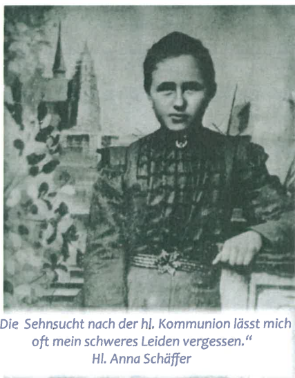
„Die Sehnsucht nach der hl. Kommunion lässt mich oft mein schweres Leiden vergessen.“ Hl. Anna Schäffer

Festgottesdienst & Fronleichnam - Prozession, Führung. Nachmittags kurze Fahrt nach Mindelstetten . Im Pilgerzentrum und Geburtshaus-Museum der hl. Anna Schäffer erhalten wir einen Einblick in ihre mystischen Leiden. Rückfahrt nach Weltenburg, Nachtessen.