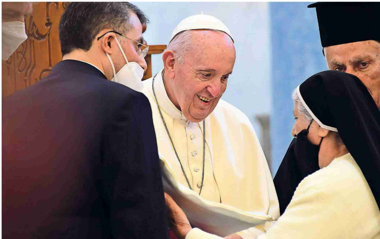
Papst Franziskus trifft mit einer Ordensfrau im Irak zusammen

Papst Franziskus besuchte als erster Papst den Irak. Die irakischen Christen durchlebten in den vergangenen Jahren eine sehr schwierige Zeit. Ihre Anzahl ging von über einer Million auf heute noch rund 250'000 zurück. Das Hilfswerk «Kirche in Not (ACN)» CH/FL möchte die irakische Bevölkerung unterstützen.