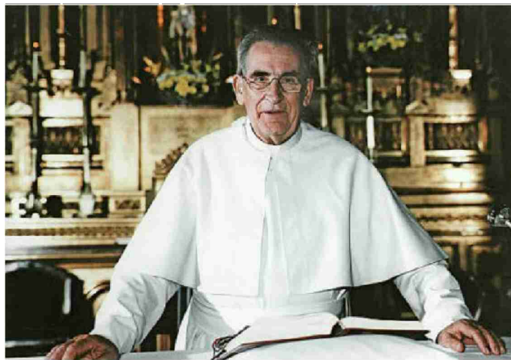
Pater Werenfried van Straaten 1992 In Spanien.