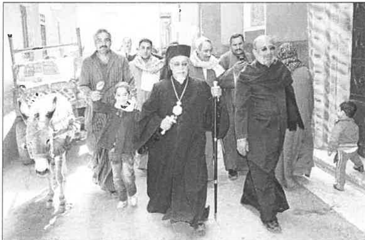
Bischof Samaan schreitet mit Gläubigen durch die Stadt.