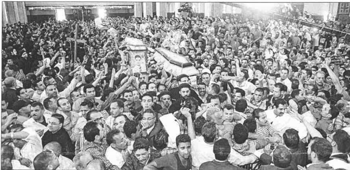
Trauerfeier in der Markuskathedrale in Kairo, Sonntag 7. April 2013.