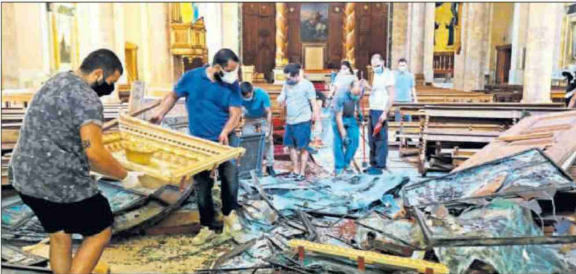
Aufräumarbeiten in der Kathedrale nach der Explosion.

Interview mit dem Pfarrer der maronitischen Gemeinde Beirut